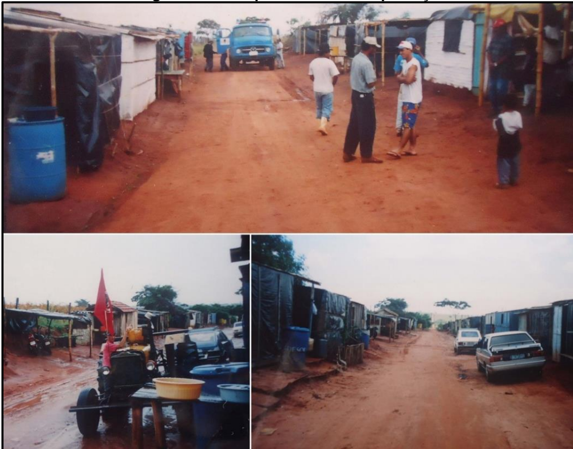
Figura 2 – Acampamento Nova Esperança

Por conta das irregularidades, o MST organizou, na região de Araçatuba (SP), várias ocupações nas fazendas consideradas improdutivas, pressionando o Estado a realizar a desapropriação das fazendas que não cumpriam sua função social 3 . Nesse contexto, no dia 14 de abril, o Abril Vermelho 4 , de 2003, ocorreu a ocupação da Fazenda Primavera, dando origem ao Acampamento Nova Esperança (Figura 2).