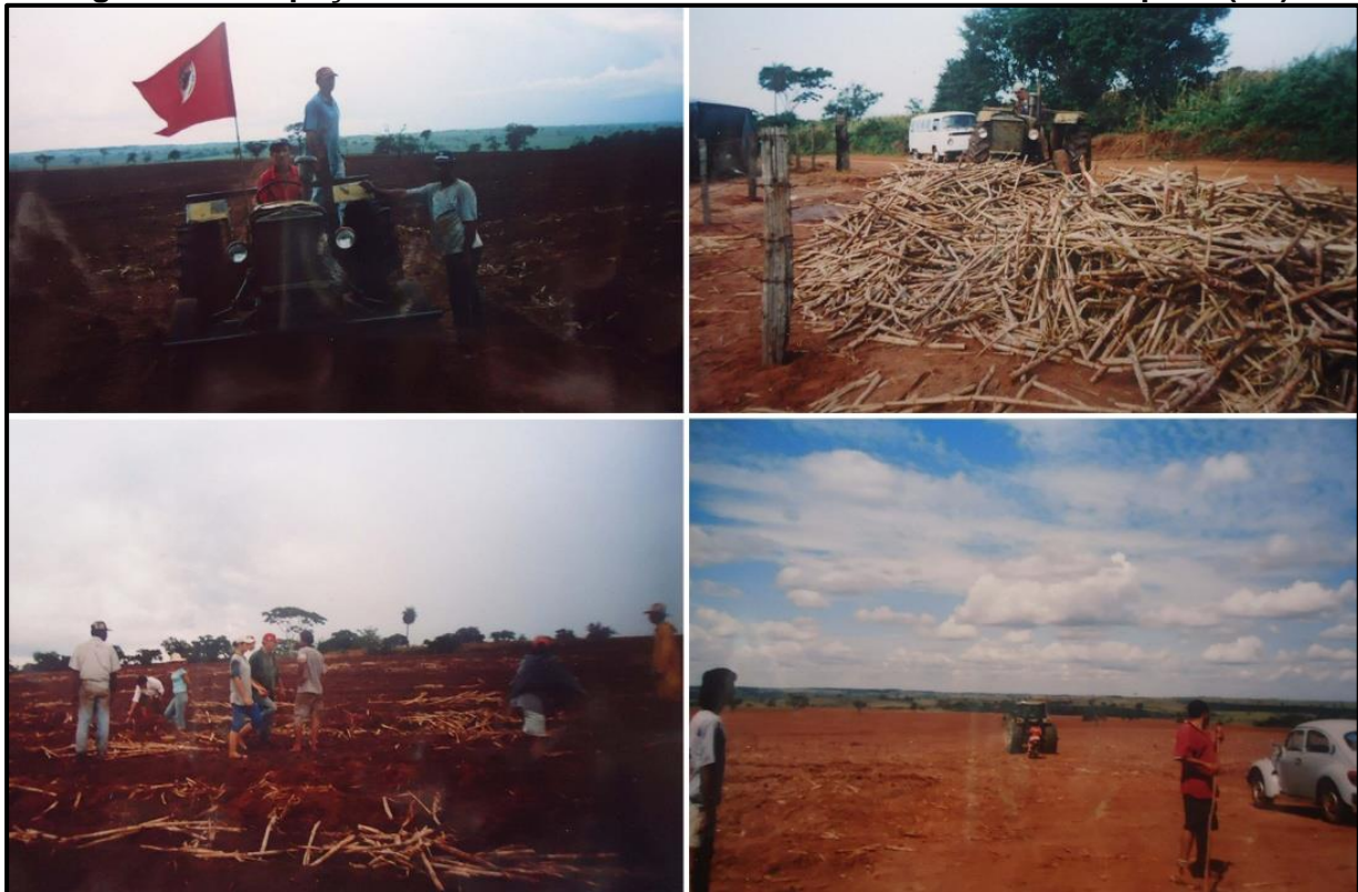
Figura 3 – Ocupação Arranca Cana na fazenda Primavera em Mirandópolis (SP)

A “Ocupação Arranca Cana”, realizada no dia 8 de abril de 2004, teve repercussão em todo o Brasil 10 . Os próprios coordenadores convocaram a imprensa com o objetivo de chamar a atenção de todos sobre a questão da improdutividade dos latifúndios. Esse ato histórico foi registrado pelos próprios trabalhadores, como ilustra a Figura 3.