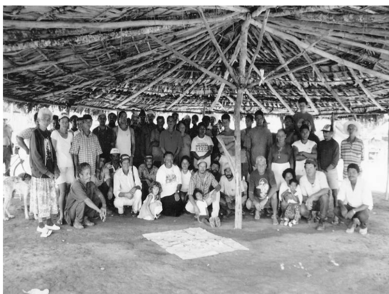
FIGURA 2 – Acampamento na fazenda Vereda, município de Padre Bernardo-GO. Durante a elaboração do PDA.

Assim, o aumento do número de ocupações de terras na região e as pressões dos movimentos de luta pelo espaço contribuíram para que o governo federal no ano de 1997 criasse na região, através do Incra, a Superintendência Regional do Distrito Federal