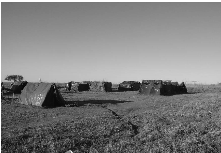
FIGURA 3 - Acampamento Irmã Dorothy, rodovia - DF 240 (Brasília), dezembro de 2006.

O primeiro fator é a falta de perspectiva em relação ao mercado de trabalho, ou seja, a especialização do mercado de trabalho e a exigência de profissionais mais qualificados fizeram com que muitos trabalhadores que moravam no entorno do DF fossem excluídos do mercado, uma vez que muitos têm baixa