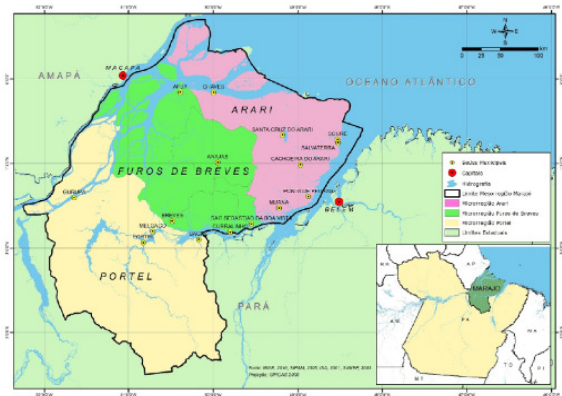
Figura 1 – Microrregiões geográficas do Marajó

Até meados da década de 1990, as áreas cadastradas como estabelecimentos agropecuários eram em torno de 25,8% (2,69 milhões de hectares) de todo o Marajó, sendo que os estabelecimentos com até 4 módulos fiscais (79% do total cadastrado) ocupavam menos de 10% da área total cadastrada (O módulo fiscal no Marajó equivale em média a 70 ha). Enquanto isso, os estabelecimentos com mais de 15 módulos fiscais (11%) correspondiam em torno de 80% da área total cadastrada. Com base nestas informações, documentos oficiais indicaram que a estrutura fundiária no Marajó estava fortemente concentrada (BRASIL, 2007; IPEA, 2015). No mesmo período, as áreas não cadastradas como estabelecimentos agropecuários no Marajó constituíam cerca de 74,2% (7,72 milhões de hectares) da extensão dessa Mesorregião, entendidas, então, como terras devolutas, arrecadadas e de Unidades de Conservação, portanto, espaço secularmente ocupado pelas populações tradicionais e onde se tem atualmente implementado a Política Oficial em questão.