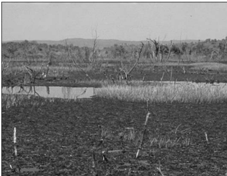
Figura 3 – Aspecto da foz do ribeirão do Carmo, após enchimento do reservatório da UHE do Lajeado